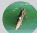
ネギコガ成虫 (体長約:4.5mm)