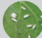
コナジラミ類 (体長約:0.7mm-1.1mm)