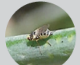
ハモグリバエ類 (体長約:2mm)