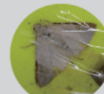
シロイチモジトウ成虫 (体長約:10mm-12mm)