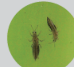
アザミウマ類 (体長約:1mm-1.6mm)