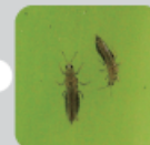
アザミウマ類 (体長約:1mm-1.6mm)