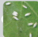
コナジラミ類 (体長約:0.7mm-1.1mm)