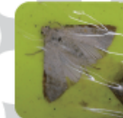
シロイチモジヨトウ成虫 (体長約:10mm-12mm)