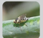
ハモグリバエ類 (体長約:2mm)