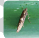
ネギコガ成虫 (体長約:4.5mm)